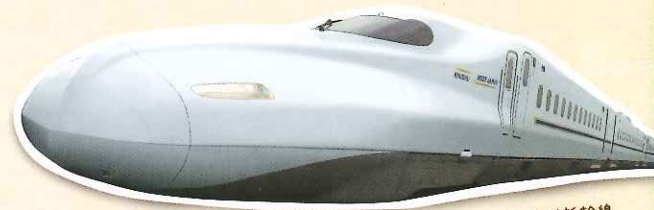
山陽・九州新幹線 「みずほ」「さくら」

おかげさまで山陽・九州新幹線の直通運転開始から1年。その感謝の気持ちと沿線の観光地の魅力をもっと知っていただきたいとの思いから、「山陽・九州新幹線直通1周年キャンペーン」を実施します。次回の旅行に使える割引券や地元特典をプレゼント。1周年スペシャルWEBサイトも公開。この機会にぜひ新幹線でお出かけください。