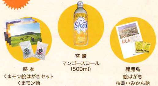
熊本 くまモン絵はがきセット くまモン缶