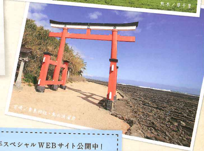
青島神社 鬼の浜海岸