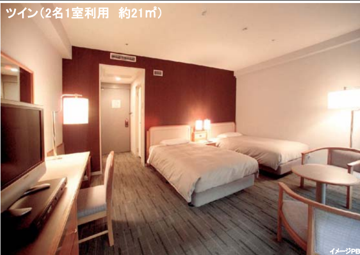
ツイン(2名1室利用 約21㎡)