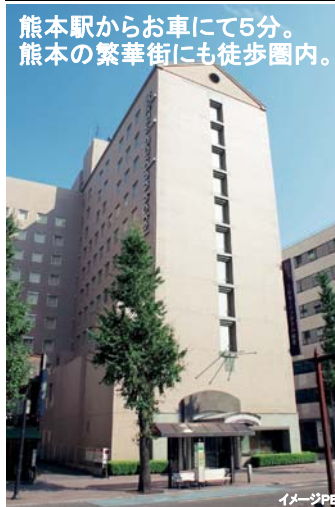
熊本駅からお車にて5分。 熊本の繁華街にも徒歩圏内。

設定期間: 2012年1月1日~3月31日 (JRセットプランは3月31日帰着まで)