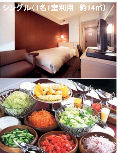
シングル(1名1室利用 約14㎡)